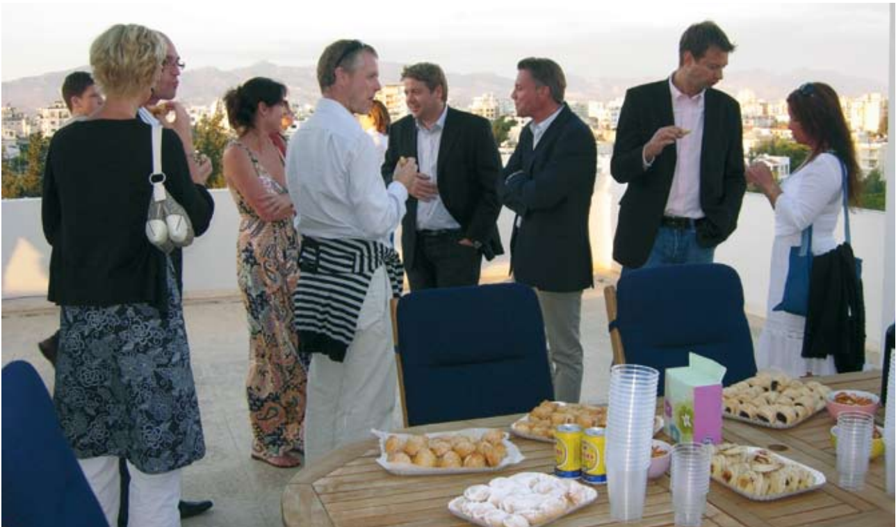
Besuch bei der Muttergesellschaft.